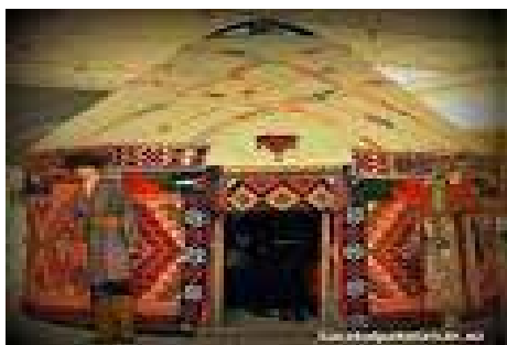
Karakalpaks sewed yurts on Navruz holiday

In time he had assembled thousands of items representing every aspect of Karakalpak folk art: costume, jewellery, carpets, yurt decorations, wood carvings, horse trappings and domestic utensils.