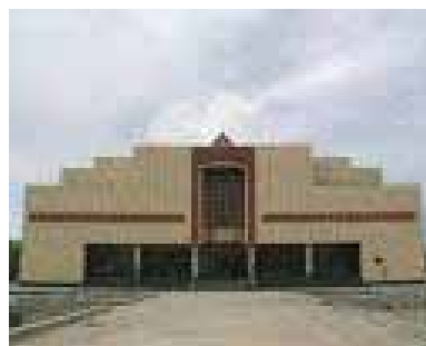
Karakalpak art museum

The foundation for the department of folk applied arts was the collection of items made by Karakalpak craftsmen. These items were collected during the expedition of Karakalpak branch of the Academy of sciences of Uzbekistan. Today the department of folk applied arts possesses a rich collection of national Karakalpak jewelry made of silver and cornelian, traditional hand-made carpets, embroidery and applique. The department of fine arts represents paintings and drawings collected by Igor Savitsky, art works donated to the Museum by noted artists of the country, and the paintings by Karakalpak artists.